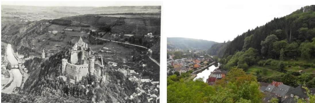
III. 4 : Vue par-dessus le château de Vianden sur le Parc de la Ville et sur le flanc adjacent au début du 20 e siècle (gauche) et aujourd'hui (droite).

Les pentes en partie raides des vallées se sont de plus en plus embroussaillées au fil des décennies en raison de l'abandon des exploitations. La conséquence en est un changement considérable de la perception du paysage à Vianden – cette vallée autrefois ouverte, claire et exposée à la chaleur est devenue boisée et ombragée : en maints endroits, il n'est plus possible de la découvrir ni même de la voir. Cette évolution a des conséquences négatives sur la qualité de vie, car plus de 80% des talus sont embroussaillés et uniquement quelques parcelles – surtout sur le versant sud – sont en cultivation (jardins, maisons de campagne, pré-verges, etc.). De même la faune et flore ont changé de caractère. Ainsi la flore rudérale datant du 20 ème siècle, comme l'Ansérine à feuilles d'obier ( Chenopodium opulifolium ) ou la chataire ( Nepeta cataria ), ou bien des espèces subspontanées, échappées des cultures comme le Néflier ( Mespilus germanicus ) ainsi que des raretés de la flore des châteaux médiévales comme la Glaucière ( Glaucium flavum ), décrites par Dr. E.J. Klein ont presque complètement disparu de nos jours.