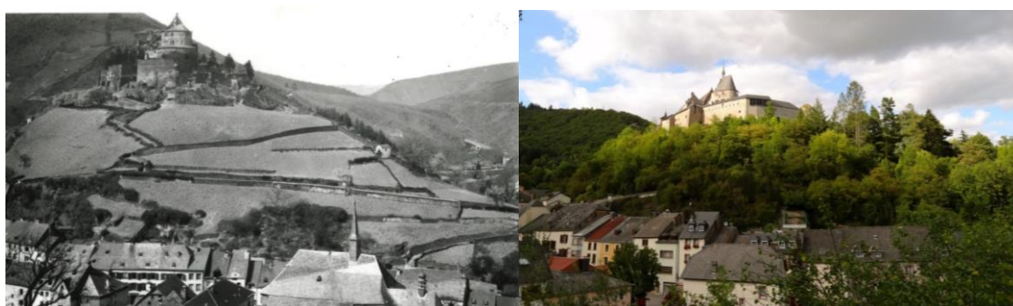
Ill. 2 : Vue sur le château de Vianden à partir du Parc de la Ville – au début du 20 ième siècle (gauche) et aujourd'hui (droite).