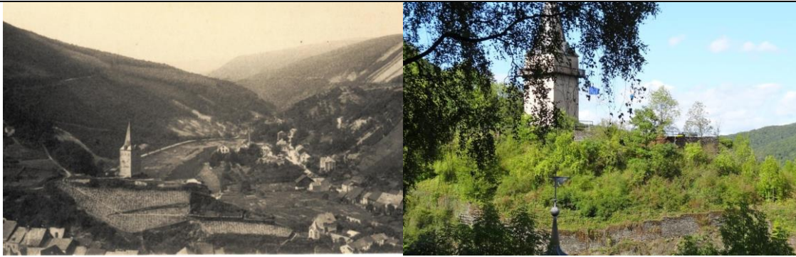
III. 3 : Vue sur la zone à l'est du château de Vianden. Sur cette photo d'époque (gauche), l'on aperçoit encore des vignobles – aujourd'hui, toute la zone est embroussaillée.