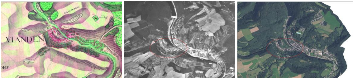
Ill. 6: Vianden : autrefois – aujourd'hui (1775-1963-2016)

Il n'existe plus de vues dégagées à partir de points panoramiques plus élevés sur le château et sur la ville et entre les deux. De plus, des paysages de culture historiques (« cultural landscape », p. ex. les vignobles, vergers, jardins en terrasse) et des habitats précieux, tels les pré-vergers traditionnels entre autres, ont également disparu. Cette évolution, ainsi que des solutions possibles, ont été présentées dans l'élaboration de la charte du paysage pour le Parc naturel de l'Our. En outre, la mairie a critiqué l'exploitation des jardins familiaux existants nuisant à l'esthétique du paysage.