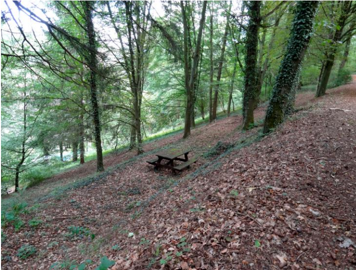
Ill. 12 : La lumière avait du mal à pénétrer sur le sol du parc à cause de la végétation à l'état sauvage.

L'élagage du capital forestier, l'abattage d'arbres pouvant représenter un danger pour les personnes, ainsi que des mesures de taille des arbres (surtout le long des sentiers) ont eu une influence bénéfique sur l'attractivité du parc. En outre, l'abattage effectué à des points stratégiques a nettement amélioré les vues panoramiques sur le château. Grâce à l'élagage, le sol forestier profite à nouveau de plus de lumière, et à moyen terme, une strate de fleurs et d'arbustes pourra s'y redévelopper.