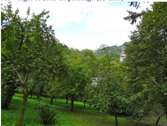
Ill. 8 : Prés-vergers non entretenus et où la prairie demandait un fauchage laborieux de la part du personnel communal.