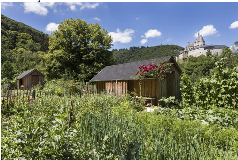
Ill. 11 : Les « Jardins modèles et jardins familiaux » servent de modèle aux autres utilisateurs des jardins.

Les résineux non conformes ont été retirés de la parcelle prévue pour les jardins familiaux, les rhizomes y ont été enlevés et la terre a été partiellement préparée pour le jardinage par fraisage. L'aménagement des espaces de jardins modèle et familiaux a influencé de manière positive les autres jardiniers, de sorte que les cabanes