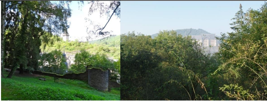
Ill. 5 : Les vues sur le château de Vianden et sur le site environnant ont presque complètement disparu.

Il n'existe plus de vues dégagées à partir de points panoramiques plus élevés sur le château et sur la ville et entre les deux. De plus, des paysages de culture historiques (« cultural landscape », p. ex. les vignobles, vergers, jardins en terrasse) et des habitats précieux, tels les pré-vergers traditionnels entre autres, ont également disparu. Cette évolution, ainsi que des solutions possibles, ont été présentées dans l'élaboration de la charte du paysage pour le Parc naturel de l'Our. En outre, la mairie a critiqué l'exploitation des jardins familiaux existants nuisant à l'esthétique du paysage.