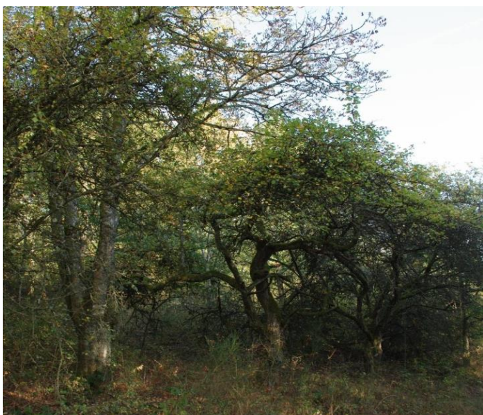
Ill. 9 : Pré-verger embroussaillé au-dessus de la zone B