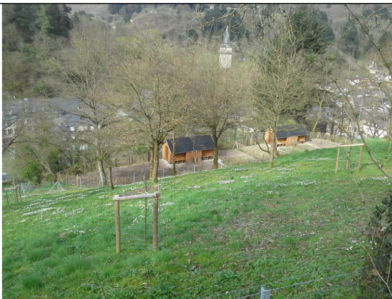
Ill. 10 : Pré-verger remis en état, actuellement pâturé par des moutons.

De vieux arbres fruitiers qui n'avaient plus été taillés depuis plusieurs années (voire des décennies) ont été revitalisés grâce à des tailles d'entretien et de remise en état effectuées par des spécialistes. De nouveaux pommiers ont été plantés à la place des arbres morts. L'on a privilégié d'anciennes variétés locales pour ainsi apporter une importante contribution à la conservation de variétés de fruits locales.