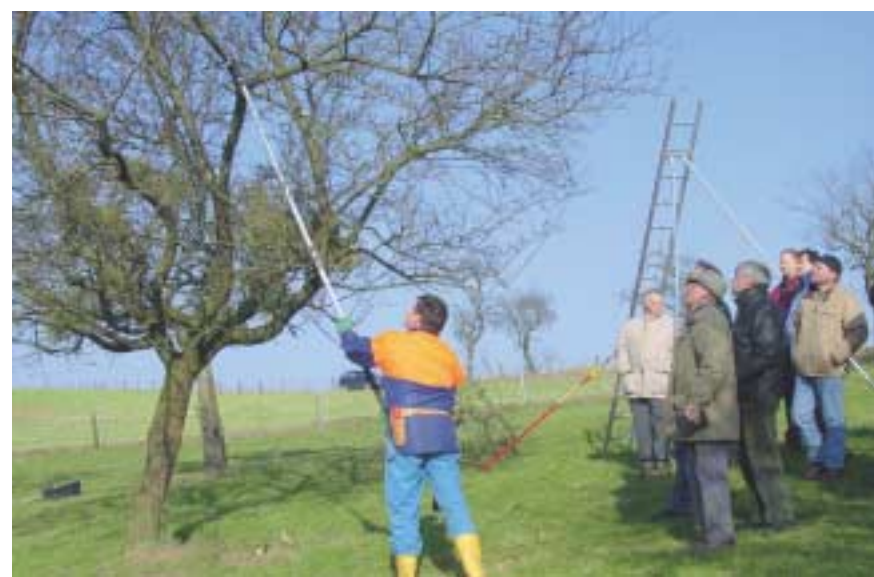
Zahlreiche interessierte Personen nahmen am Obstbaumschnittkurs am 15. März 2003 in Longsdorf teil.

Bei Naturschutzfragen können Sie sich an die Biologische Station des Naturpark Our wenden, Tel. 908188-34.