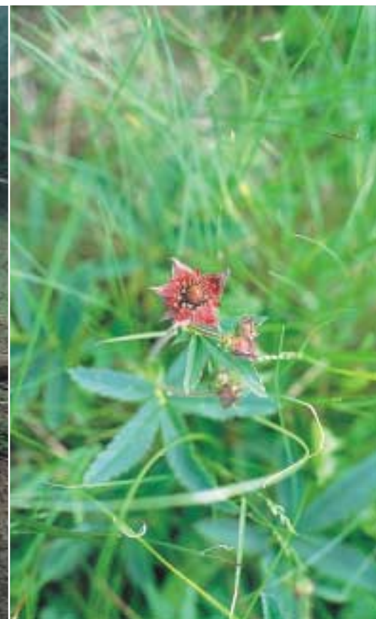
Das Sumpfblutauge «Comarum palustre» ist eine seltene Feuchtwiesenpflanze.

Seit dem 1. September 2002 funktioniert im Naturpark Our eine von vier Biologischen Stationen, die es in Luxemburg gibt. Zu diesem Zweck wurde die Diplomökologin Mireille Schanck vom SIVOUR eingestellt. Über eine Konvention zwischen dem Umweltministerium und dem SIVOUR ist der Tätigkeitsbereich festgelegt. Die Aufgaben setzen sich einerseits aus staatlichen Projekten und andererseits aus kommunalen Arbeiten im Rahmen des Naturschutzes im Gebiet des Naturpark Our zusammen.