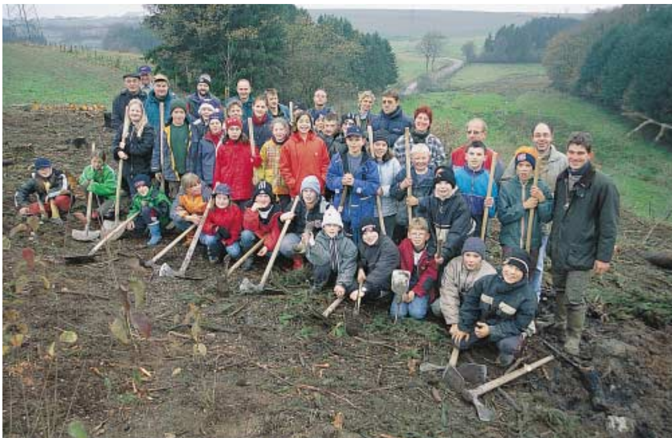
Gruppenbild der begeisterten Helfer am Tag des Baumes 2002 in Urspelet.